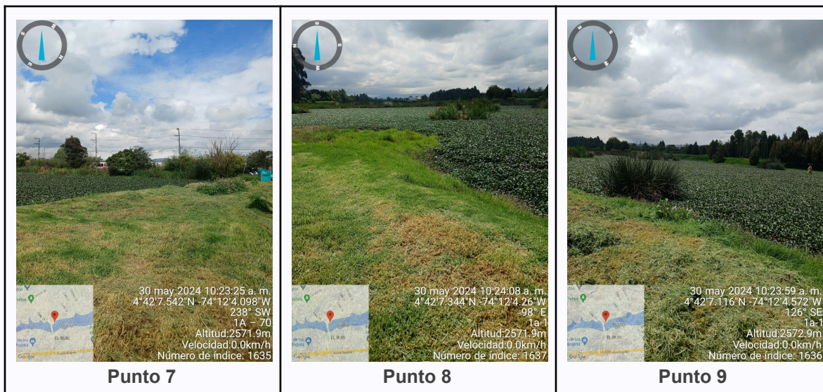
JENNIFER ANDREA TOVAR RODRÍGUEZ Gestora ambiental Contrato de prestación de servicios CPS2024047

C.P 250020 Tel. (601) 8234070 823 40 71 / 823 40 73 Fax. (601) 8257620 Dir. Cra. 14 No. 13-05 03-FR-17 VER.10.2024